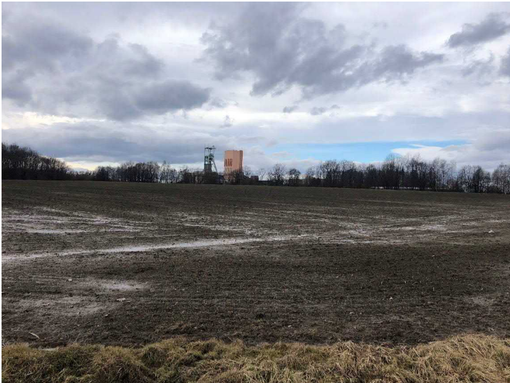
Obytná zástavba severně od lokality ČSM Jih