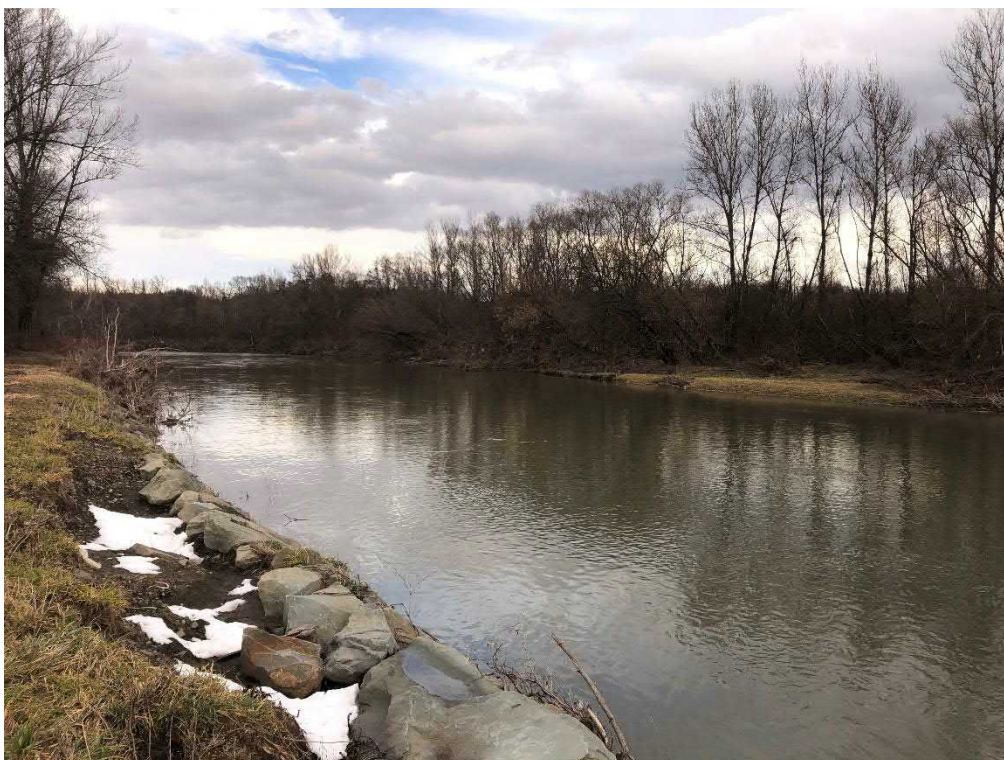
Karvinský potok před vyústěním do vodní plochy Kozinec